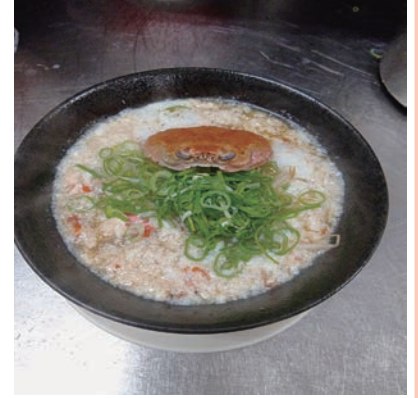
丸ごと一匹セコガニラーメン 1,600円